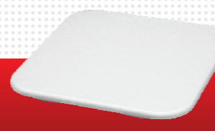
Tampa para Bandeja Cód. 086686