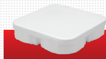
Bandeja para Marmita Pequena Cód. 086694